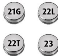
Funktioniert mit diesen Thermo und Hygro Button